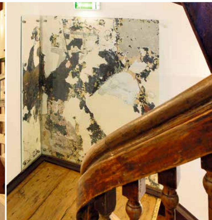
Osa maalingufragmente paistab kaitsva klaasi alt.