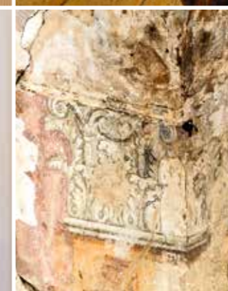
Museumitöö Korintose kapiteeli motiiviga maalingud ootavad suve, mil kunstiakadeemia tudengid neid konserveerima hakkavad.