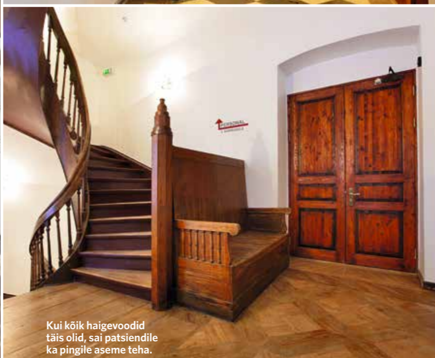
Kui kõik haigevoodid täis olid, sai patsientidele ka pingile aseme teha.