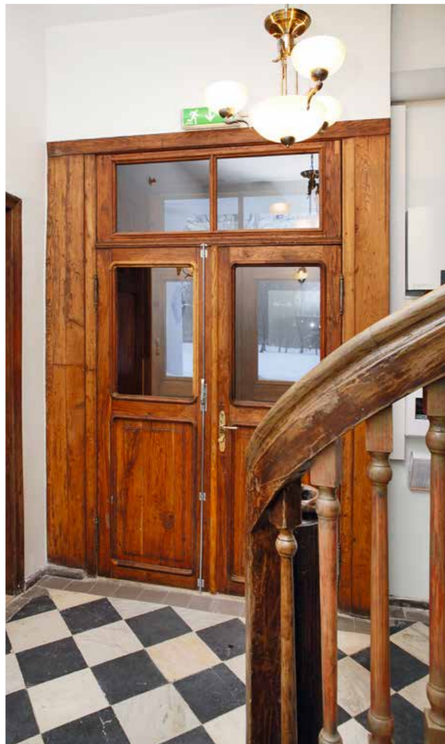
Kauni marmorpõrandaga fuajee ja paraaduks.

Kunagise krahvilossi keskosa all on viiest silindervõlviga ja kahest ristvõlviga ruumist