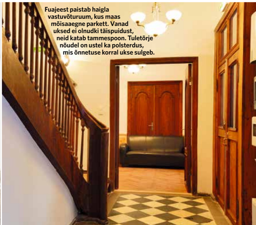
Fuajee paistab haigla vastuvõturuum, kus maas mõisaegne parkett. Vanad ukseked ei olnudki täispuidust, neid katab tammespoon. Tuletõrje nõudel on ustel ka polsterdus, mis õnnetuse korral ukse sulgeb.

1922. aastal jagati osa Krahviaia pargist elamukruntideks. 1925 ostiski Lääne maavalitsus Niko-